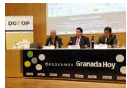
Debate en la Cámara de Comercio de Granada.