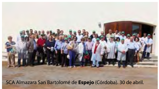
SCA Almazara San Bartolomé de Espejo (Córdoba). 30 de abril.