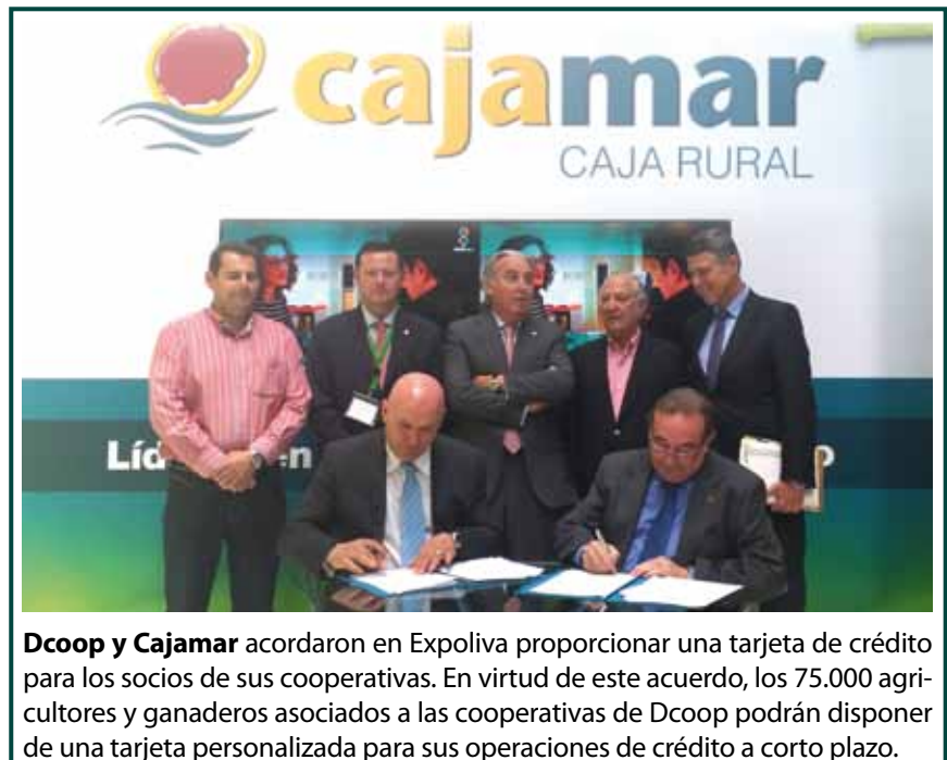
Dcoop y Cajamar acordaron en Expoliva proporcionar una tarjeta de crédito para los socios de sus cooperativas. En virtud de este acuerdo, los 75.000 agricultores y ganaderos asociados a las cooperativas de Dcoop podrán disponer de una tarjeta personalizada para sus operaciones de crédito a corto plazo.

que allí encontramos: GEA Westfalia Separator presentó algunas de sus innovaciones como 'Varipond', un sistema de control milimétrico del punto de rebose que evita que se tenga que detener el decánter. O el distribuidor jiennense de Bobcat, que presentó las cargadoras compactas de orugas T770 con una tracción que se ha incrementado entre un 15 y un 20 por ciento para proporcionar una mayor potencia de empuje y excavación. Y Dakolub que distribuye la línea de lubricantes OLV de Verkol, una gama de aceites y grasas específicos para aplicaciones de la industria del olivar.