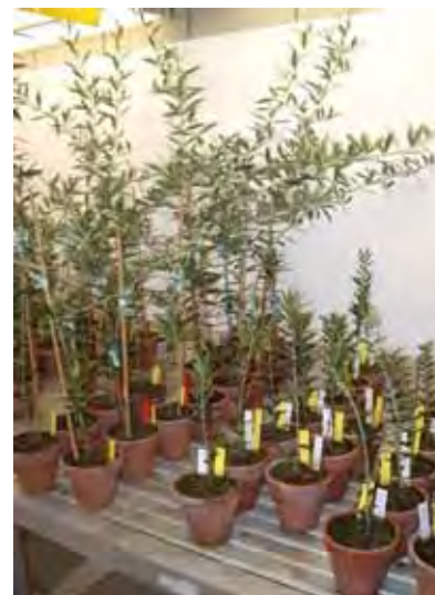
Diferencia entre un olivo micorrizado y otro sin micorrizas.