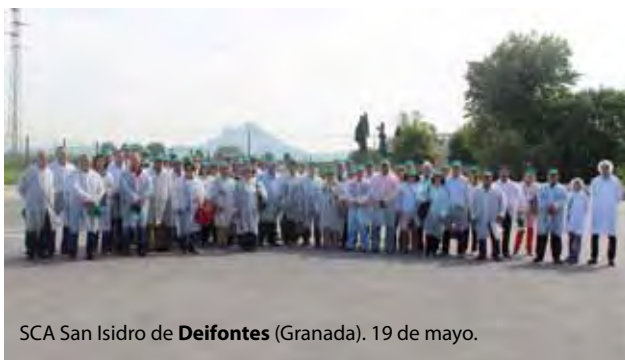
SCA San Isidro de Deifontes (Granada). 19 de mayo.