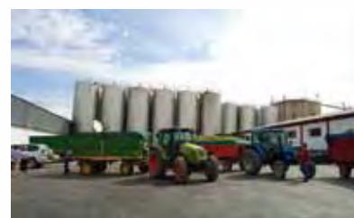
Patio de recepción de uva.