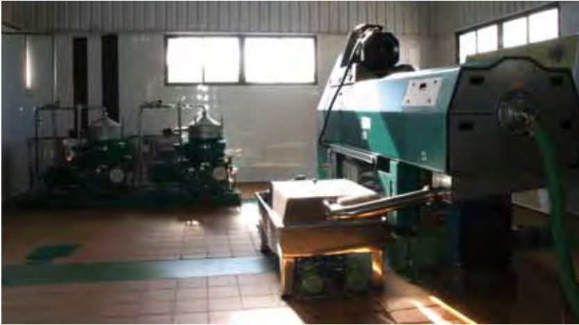
La cooperativa ha habilitado toda la maquinaria necesaria para la producción en ecológico.

Con el fin de satisfacer la demanda de un nutrido grupo de socios que empezaron a producir aceituna ecológica, la cooperativa La Unión de Úbeda ha montado un grupo de molturación exclusivamente