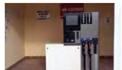
Nuevo sistema para suministrar gasoil.

La cooperativa Olivarera Jesús Nazareno (Aguilar de la Frontera) ha instalado recientemente un nuevo sistema para suministrar gasoil A para los vehículos y gasoil B para maquinaria agrícola y tractores. Para el suministro de carburante son necesarias dos tarjetas: una para identificar al socio y la segunda es cualquier tarjeta de crédito adscrita a la cuenta del socio en el banco. La máquina suministradora tiene un diseño moderno y va indicando al usuario los pasos a seguir.