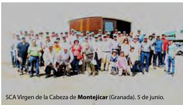
SCA Virgen de la Cabeza de Montejícar (Granada). 5 de junio.