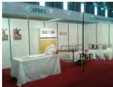
Stand de Capriex en Fecsur.

unas jornadas técnicas sobre el sector caprino, lácteo y su transformación en las que participó el personal del Centro de Investigaciones Científicas y Tecnológicas de Extremadura (CICYTEX), quienes presentaron los últimos avances de investigación, así como a comerciales de productos veterinarios y zoonosanitarios, entidades bancarias, biólogos, comercializadores, productores, etc.