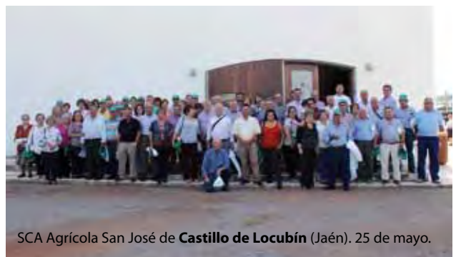
SCA Agrícola San José de Castillo de Locubín (Jaén). 25 de mayo.