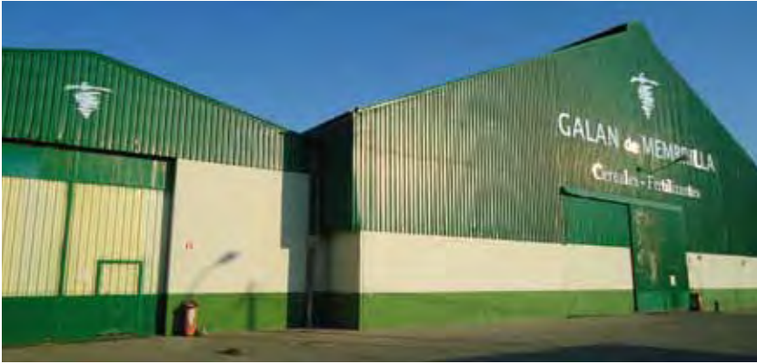
Fachada de las instalaciones de la cooperativa en Manzanares.

Esta integración incluye la producción a granel, "donde el beneficio fundamental de esta operación", afirma el presidente de Galán de Membrilla, "más que vender es poder expandirnos a nivel internacional; Dcoop tiene su logística, sus clientes habituales..., y eso a nosotros nos beneficia mucho". Sin embargo, la estructura de la cooperativa no cambia, "simplemente ponemos nuestro producto al servicio de la cooperativa de segundo grado, pero para nosotros lo demás permanece igual, nuestras deci-