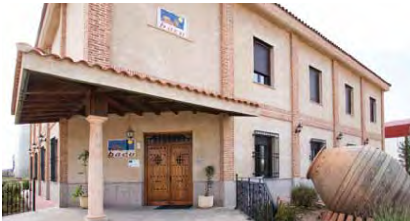
Oficinas de Dcoop-Vinos Baco en Alcázar de San Juan (Ciudad Real).