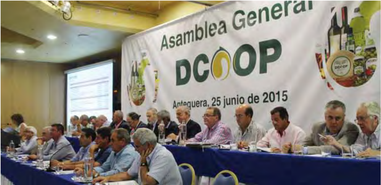
El pasado día 25 de junio se celebró Junta de Sección de Aceite, Asamblea General Ordinaria y Asamblea General Extraordinaria en Antequera.

Dcoop incrementó su volumen de negocio en un 25 por ciento hasta los 756 millones de euros en el ejercicio 2014 gracias a las operaciones de integración de nuevas cooperativas aceiteras, como la granadina Tierras Altas, y a la diversificación de su actividad mediante otras fusiones como las de Baco en vino y Procasur en caprino de leche.