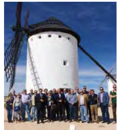
Visita de Cevico.

Ubicada en la zona de la Narbona, en el Languedoc Roussillon de Francia, la cooperativa Val d'Orbieu es el grupo más grande de vino no