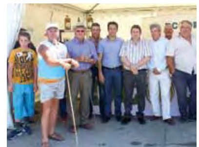
Socios ganaderos y caprinos en Agrogant.

Dcoop acudió fiel a su cita en la Feria Agrícola y Ganadera de Antequera Agrogant, del 29 al 31 de mayo, dando a conocer nuestros productos por medio de degustaciones de aceite, cárnicos, quesos, vinos... Este año, además, la División de Caprino de Dcoop ha participado con stand propio en la feria al margen del situado en la carpa gastronómica.