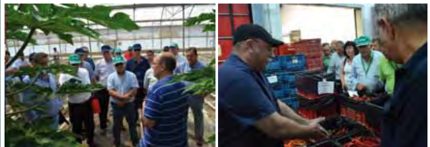
Visita a la Estación Experimental de las Palmerillas y a Murgiverde en El Ejido (Almería).

Más información en www.dcoop.es/atencion-al-socio/zona-de-socios .