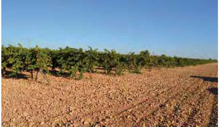
Viñedos en Alameda de Cervera (Ciudad Real).

En cuanto a la producción mundial de vino, tras un año récord en 2013 (291 millones hl.) en 2014, se ha registrado un buen nivel (279 millones hl.). En relación con 2015, las primeras estimaciones de la producción de vino en el hemisferio sur permiten prever una ligera reducción de aproximadamente un 3% respecto a 2014, en una horquilla comprendida entre 53 y 57 millones de hl., según datos ofrecidos por la OIV.