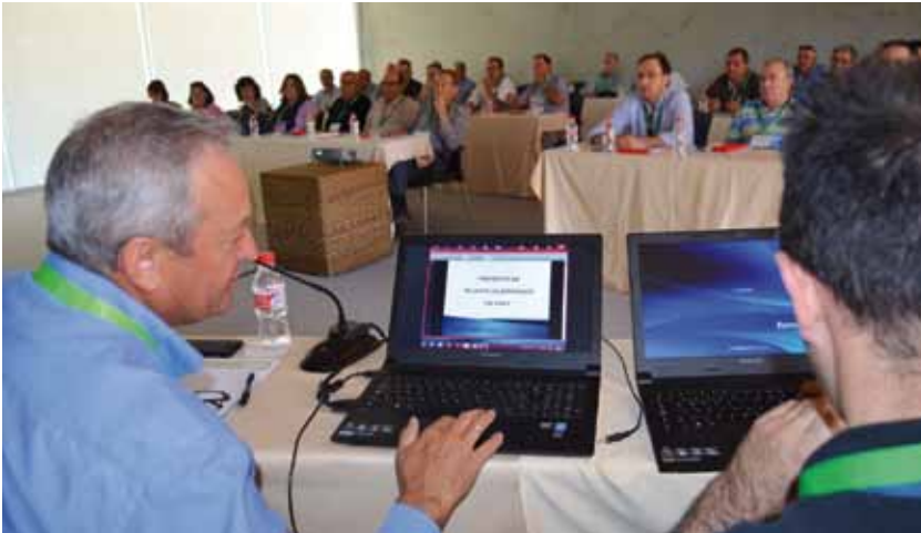
Reunión de la Sección de Vinos durante la Convención.

sistema de liquidación. Por otro lado, hizo hincapié en los esfuerzos realizados por Dcoop para ayudar a las cooperativas asociadas a reducir costes de producción aprovechando las sinergias que favorece la integración.