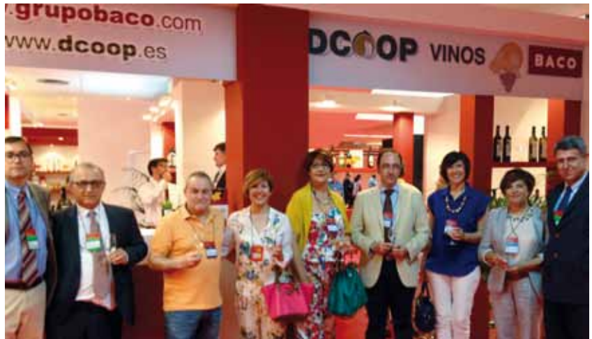
Visita de los socios de Dcoop a Fenavin.

Dominio de Baco Tempranillo, Dominio de Baco Airén (que ha