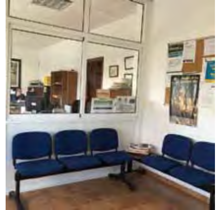
Aspecto que ofrece el renovado patio de recepción de aceitunas y las oficinas.

pos para incorporar a la planta de producción continua de aceite, que sustituyen a otros en esta-