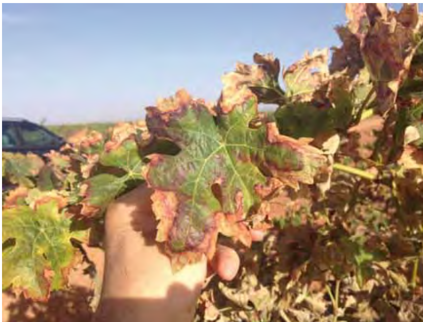
Daños provocados tras sucesivas picaduras.

Desde el Departamento de Gestión Agrícola de la Sección de Vinos de Dcoop, se ha aconsejado para aquellas parcelas en las cuales el ataque ha sido temprano (principios de Agosto) que se hiciera un tratamiento a base de Imidacloprid al 20%, siempre y cuando transcurrieran al menos 14 días desde el tratamiento a la fecha de cosecha, ya que es el plazo de seguridad con el que cuenta el producto. Para los ataques tardíos, la recomendación está sien-