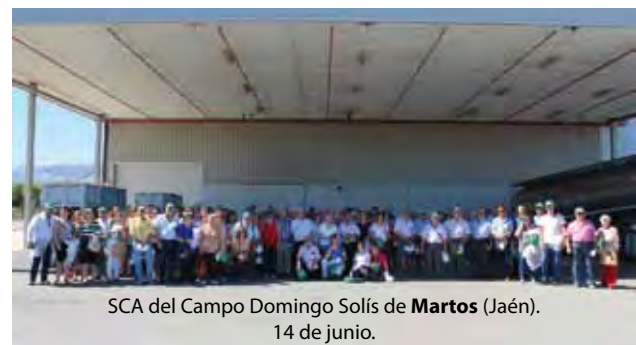
SCA del Campo Domingo Solís de Martos (Jaén). 14 de junio.