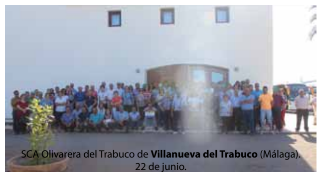
SCA Olivarera del Trabuco de Villanueva del Trabuco (Málaga). 22 de junio.