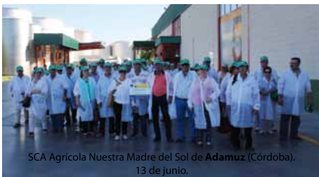
SCA Agrícola Nuestra Madre del Sol de Adamuz (Córdoba). 13 de junio.