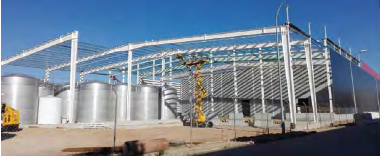
La envasadora de vino en Alcázar de San Juan (Ciudad Real) ha concluido su primera fase.

Dcoop ha iniciado un intenso período de inversiones en proyectos de industrialización y comercialización encaminados a crear valor añadido a la producción de las secciones que lo integran. El reconocimiento hace ahora un año de Dcoop como Entidad Asociativa Prioritaria por parte del Ministro de Agricultura (Magrama) comienza a dar su fruto en forma de subvenciones en proyectos de industrialización de las principales secciones del Grupo. En este sentido, ayudas en algunos proyectos del 40 por ciento para las principales inversiones y de hasta el cien por ciento en otros casos darán un importante impulso a los planes de industrialización de la producción de nuestros socios en aceite, vino, ganadería y, en general, en mejoras que redundarán en una mejor comercialización y, por