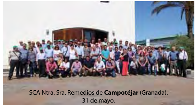
SCA Ntra. Sra. Remedios de Campotéjar (Granada). 31 de mayo.