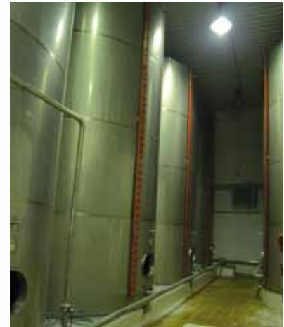
La bodega se ha adaptado a la normativa.

En 2015, la facturación de la cooperativa alcanzó los 9,8 millones de euros, lo que representa un