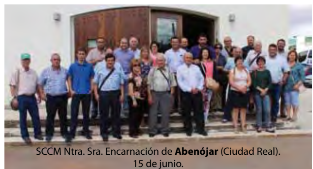
SCCM Ntra. Sra. Encarnación de Abenójar (Ciudad Real). 15 de junio.