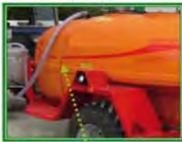
Fig. 8. Indicador de nivel visible desde el lugar de llenado.