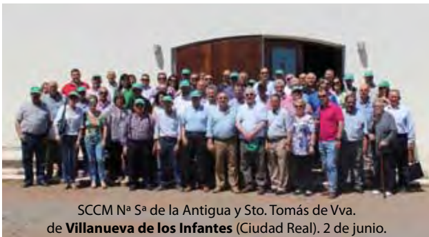
SCCM Nª Sª de la Antigua y Sto. Tomás de Vva. de Villanueva de los Infantes (Ciudad Real). 2 de junio.