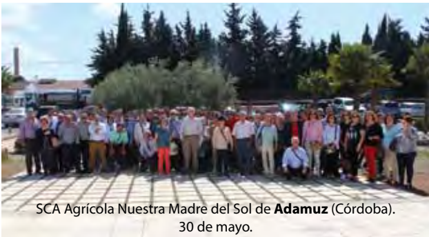
SCA Agrícola Nuestra Madre del Sol de Adamuz (Córdoba). 30 de mayo.