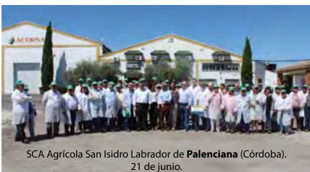
SCA Agrícola San Isidro Labrador de Palenciana (Córdoba). 21 de junio.