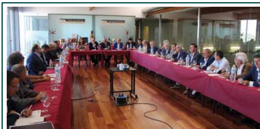
Reunión del Consejo Rector en Labastida

El Consejo Rector de Dcoop se reunió con el Viceconsejero de Agricultura, Pesca y Política Alimentaria, Desarrollo Económico y Competitividad del Gobierno Vasco, Bittor Oroz, a finales de agosto en la cooperativa asociada a la Sección de Vinos Unión de Cosecheros de Labastida.