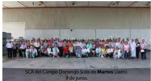
SCA del Campo Domingo Solís de Martos (Jaén). 9 de junio.