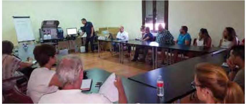
Técnicos de Foss explican el funcionamiento de WineScan.

Las bodegas y laboratorios utilizan ya WineScan para proteger y