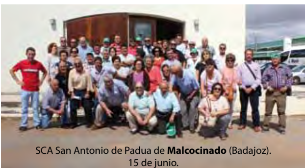
SCA San Antonio de Padua de Malcocinado (Badajoz). 15 de junio.