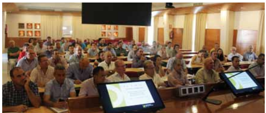
Nutrida asistencia a las jornadas en Antequera.

de Andalucía, desgranaron las últimas modificaciones de la normativa sobre el régimen de funcionamiento de las secciones de crédito en las cooperativas.Cuál es el objeto de una sección de crédito, propuestas de régimen interno de las mismas o planes de prevención de delitos en las cooperativas fueron algunos de los puntos que se desarrollaron a lo largo de la jornada.