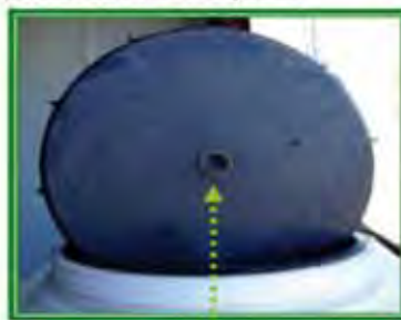
Fig. 7. Compensación de presiones: orificio en la tapa del depósito.