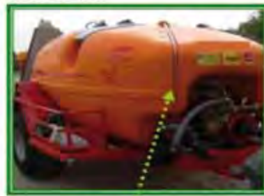
Fig. 9. Indicador de nivel visible desde el puesto del conductor.

(carretilla) con depósito de hasta 100 litros.